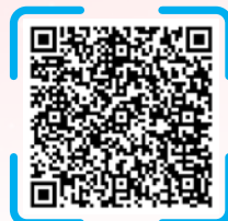
新界西醫院聯網 病人資源中心