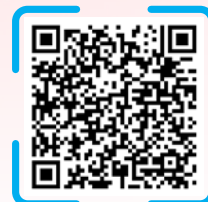
新界西糖尿病社區資源冊 (2023年4月至6月)