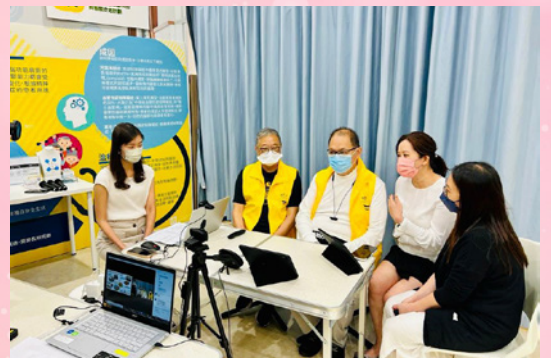
屯門醫院與病友組織「糖糖正正」定期舉辦網上專題講座，提升大眾對糖尿病的關注。

世界衛生組織及國際糖尿病聯盟將每年的 11 月 14 日定為「世界糖尿病日」。去年的主題是「醫社與你 共建控糖生活」，為響應「世界糖尿病日」，提升大眾對糖尿病的關注，屯門醫院與區內不同服務單位，包括地區康健中心、嶺南大學、病友組織「糖糖正正」等舉辦了一系列專題講座及活動。