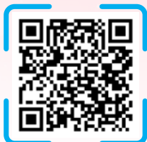
糖糖正正 — 糖心小聚 Facebook 專頁